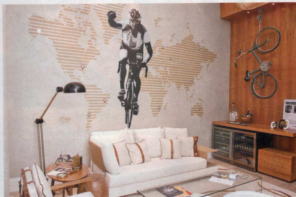
Hobby do Dono da Casa: com o ciclismo como temática, serve à programação e recordação das aventuras