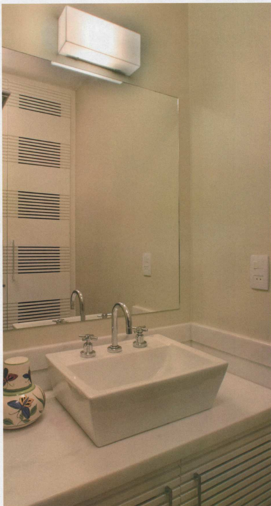
O branco é a cor predominante no banheiro da suíte, que conta com gabinete e armário em laca e bancada de mármore