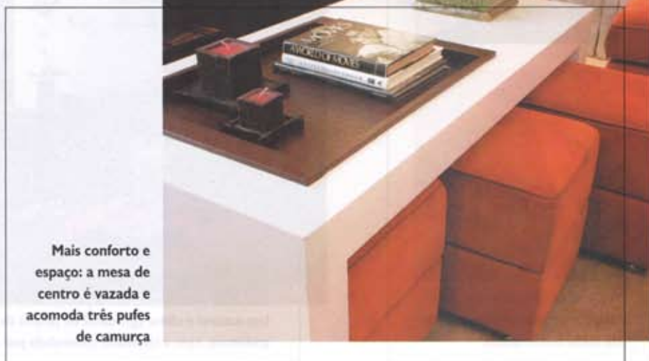
Mais conforto e espaço: a mesa de centro é vazada e acomoda três pufes de camurça