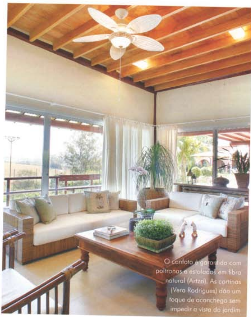
O conforto é garantido com poltronas e estofados em fibra natural (Artzzi). As cortinas (Vera Rodrigues) dão um toque de aconchego sem impedir a vista do jardim

“Entre os maiores segredos para morar bem está a possibilidade de convívio diário com alguns dos elementos básicos da Natureza”, revela a arquiteta Silvia Cabrino, que buscou na paisagem a inspiração para este projeto. Na antiga fazenda da família, no sul de Minas, uma casa voltada ao lazer, e totalmente envolvida pelo verde, tornou-se o ponto de encontro de filhos, netos e amigos.